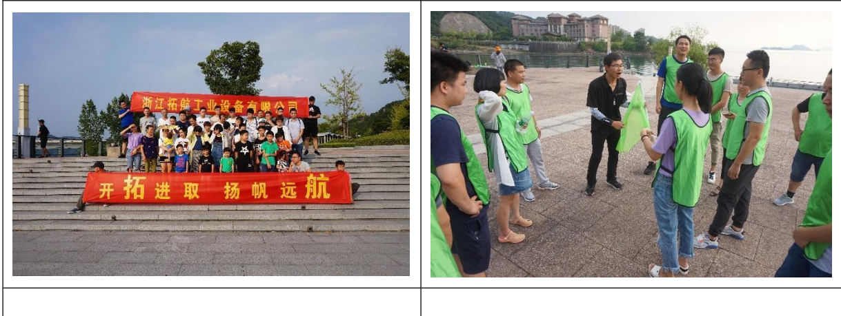
图表 8 员工活动图

建立了员工满意度管理制度，通过多种途径来识别影响员工满意的因素。针对不同的员工群体采用适当的方式，包括组织部门会议、职工代表会、新进员工座谈会、离职员工访谈，收集员工抱怨和投诉，开展专项调查等多种方式来识别影响员工满意的关键因素，最终确定影响整体员工满意的关键因素。