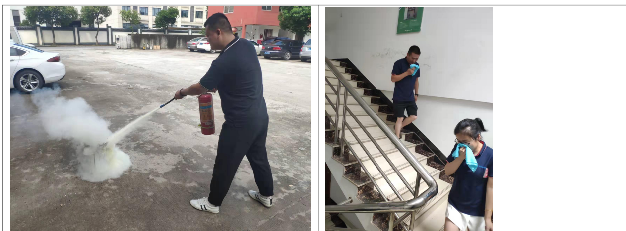
图表 10 拓航工业消防、应急预案演习