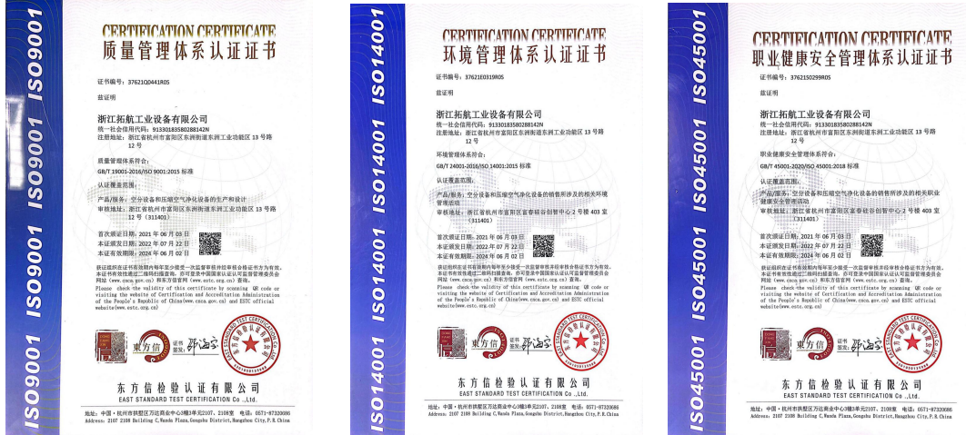
图表 3 体系认证证书

拓航工业于 2023 年导入“浙江制造”模式进行管理，结合质量、环境、职业健康安全、卓越绩效管理模式、质量诚信标准要求建立了综合型管理体系。