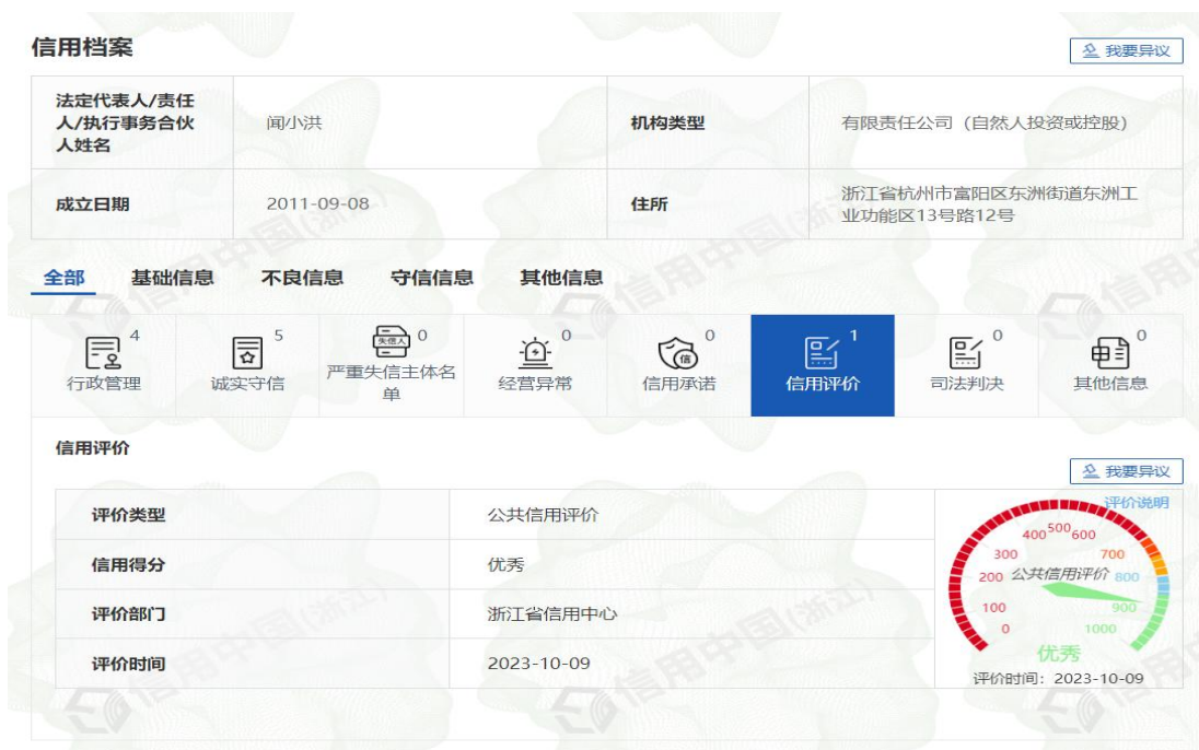
图表 14 道德行为相关结果

公司一直以来坚持诚信为本，依法经营，信守职业道德，树立了良好的商业信用和道德形象，获得顾客、供应商、政府、质监、工商、税务、银行等的广泛好评，赢得了社会各界高度认可。