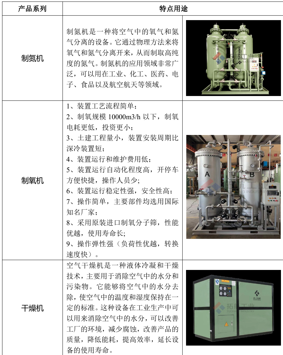
图表 2 公司产品种类及用途

公司致力于管理和创新工作，先后通过质量（ISO9001）、环境（ISO14001）、职业健康安全（ISO45001）体系认证。公司 2022 年导入卓越绩效管理模式。同时，公司建立