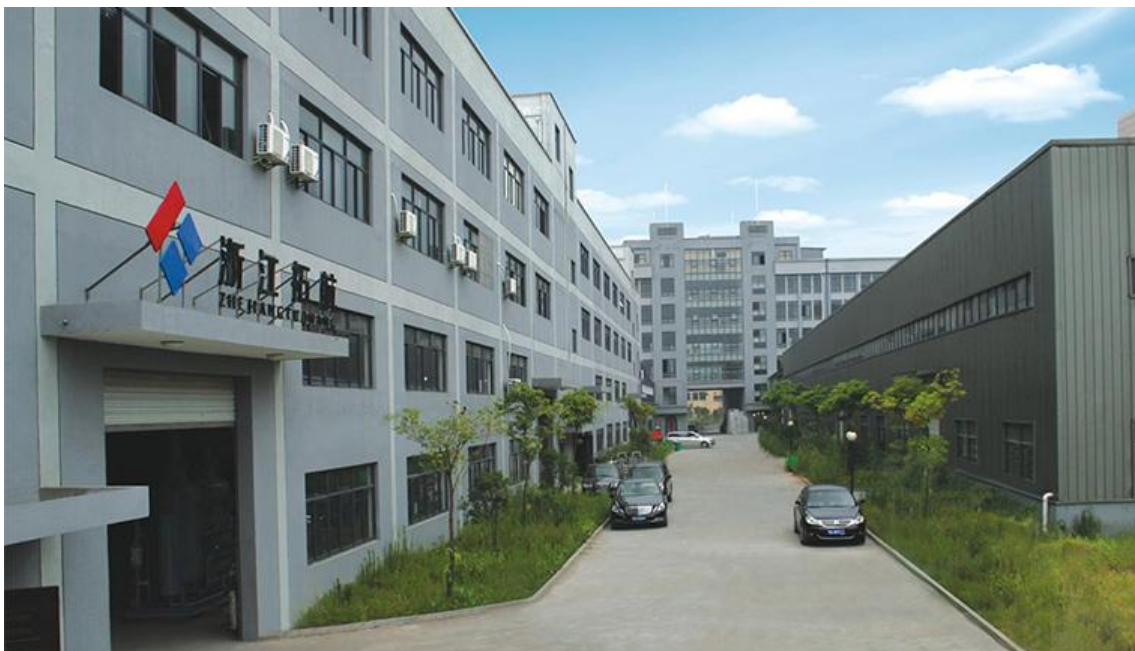
图表 1 公司总部厂区图

激情拼搏，活力四射的拓航人，以“满足客户，奉献社会”为己任，勇于开拓，不断进取，在科技创新的道路上成就辉煌的事业。